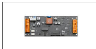
fi dm-x-dali 4