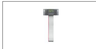
fi assist display-90