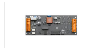
fi dm-x-dsi 4