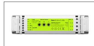
fd dmx 3-48e