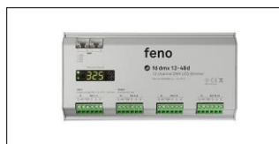
fd dmx 12-48d