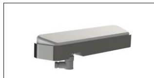
fe s.soft lt1-4 pro